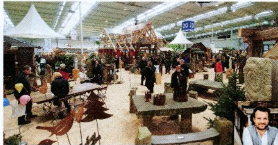
Alte Baumaterialien neu in Szene gesetzt: Martin Blöcher ist stolz auf seinen gelungenen Messestand

deutschland, aber auch aus Übersee greifen auf das Angebot des Lemgoers zurück. Die Ideen scheinen ihm nicht auszugehen: aus altem Holz und Steinen entstehen Möbel, Lauben oder Gartenaccessoires. Aber auch auf Originalteile wie alte Türen, etc. kann zugegriffen werden.